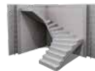
ELŐREGYÁRTOTT FALAK ÉS LÉPCSŐK