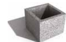
Leier beton pillérzsaluzó elem