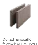
Durisol hanggátló falazóelem DMi 15/9 L