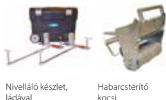
Nivelláló készlet, ládával